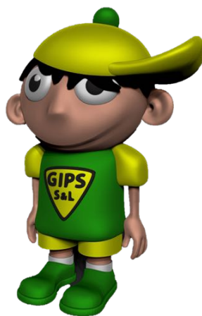
afb.: eerste ontwerp van mascotte Olle in 3D