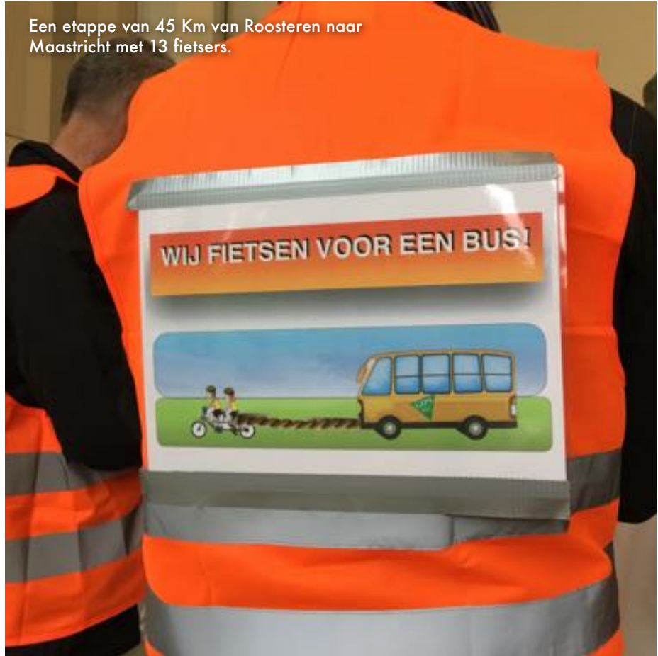
Een etappe van 45 Km van Roosteren naar Maastricht met 13 fietsers.