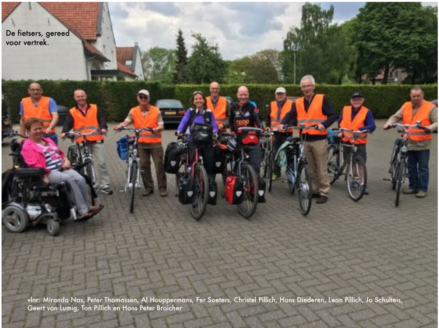
De fietsers, gereed voor vertrek.