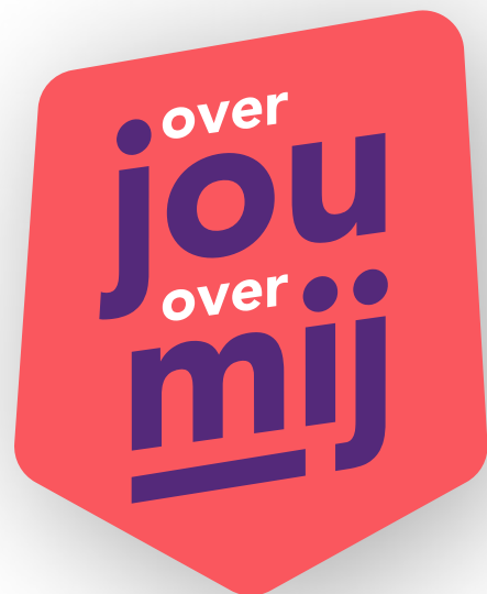
Campagne / Logo

We proberen een zo groot mogelijk publiek te bereiken door een diversiteit aan uitingen op verschillende momenten, voor verschillende doelgroepen in te zetten. Ter ondersteuning van de campagne worden naast de Vitual Reality Experience een campagnesite ( www.OverjouOvermij.nl ), een magazine en sociale media ingezet.