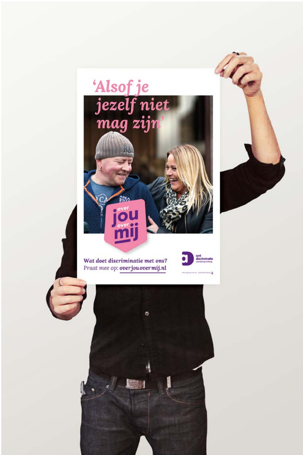
Campagne / Affiche