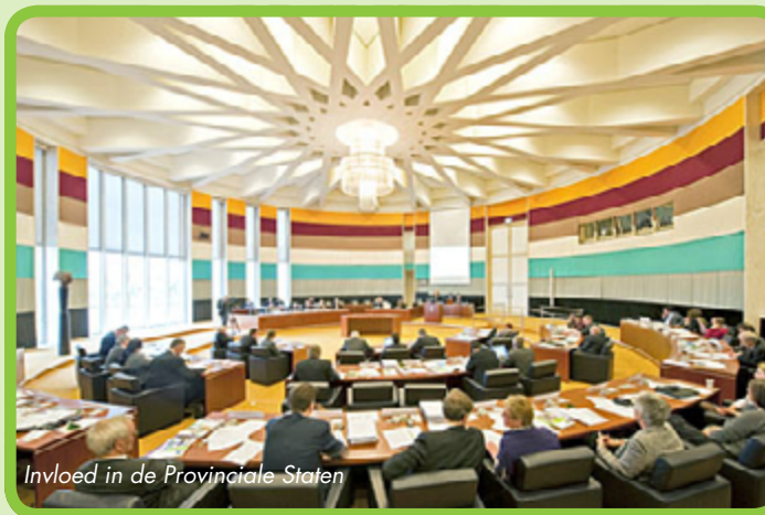
Invloed in de Provinciale Staten

Uit analyse van de nieuwsdienst LocalFocus blijkt dat mannen nog steeds de kieslijsten voor de Provinciale Verkiezingen domineren. In Limburg is 70,6 % van de kandidaten man. Het percentage vrouwen komt in geen enkele provincie boven de 36 % uit. Een kwestie van old boys network ? Of is het aan de vrouw zelf om haar zichtbaarheid te vergroten en lef te tonen?